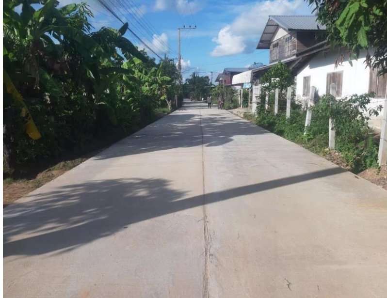
ถนนคอนกรีตเสริมเหล็ก หมู่ ๑๑