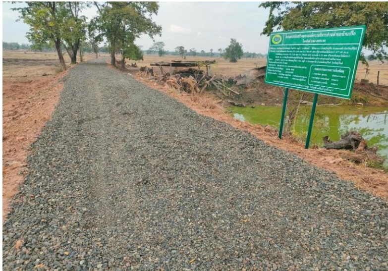
ก่อสร้างถนนคอนกรีตเสริมเหล็กบ้านตาสะดำใหญ่ หมู่ที่ ๖